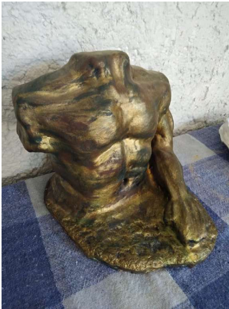
Figura 3: Força e poder