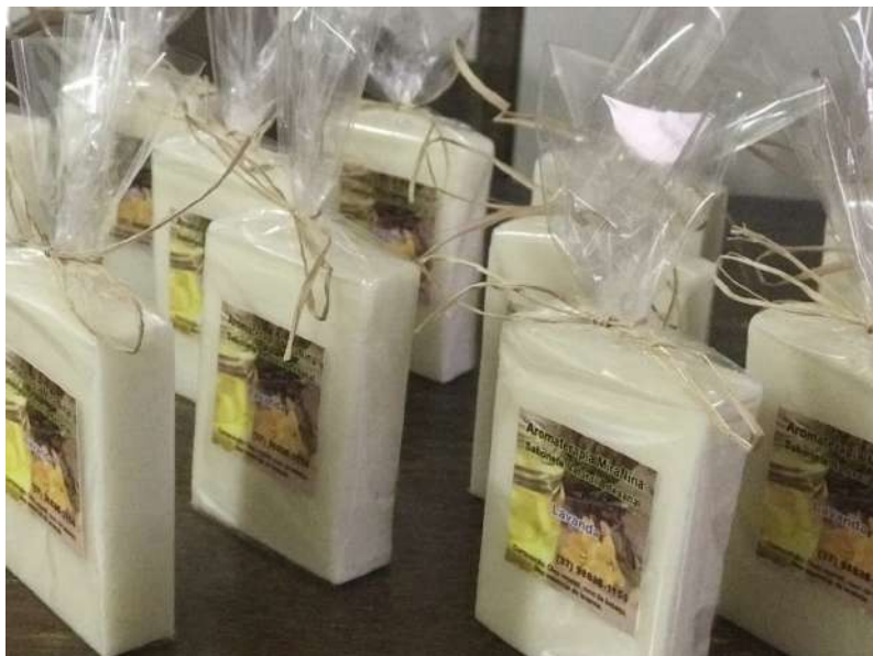
Figura 29: Sabonete