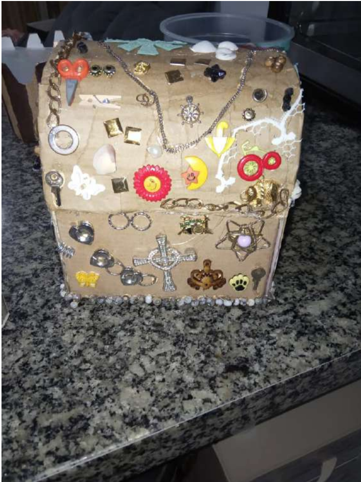
Figura 8: Porta-joias