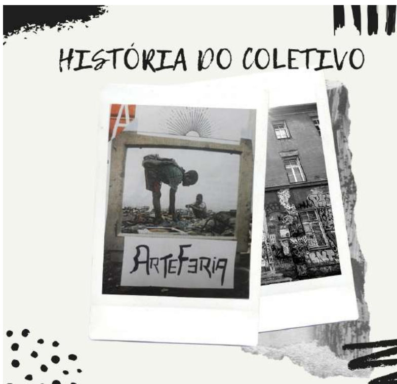
Figura 16: Arteferia