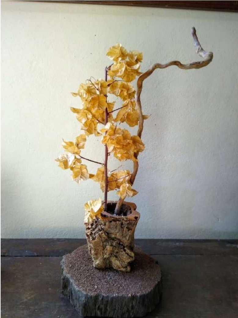
Figura 15: Paisagismo