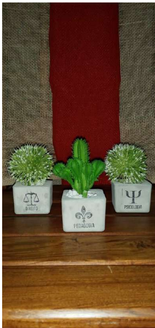
Figura 24: Profissões