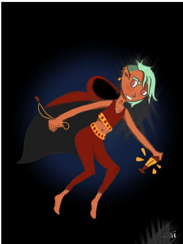
Figura 22: Desenho digital