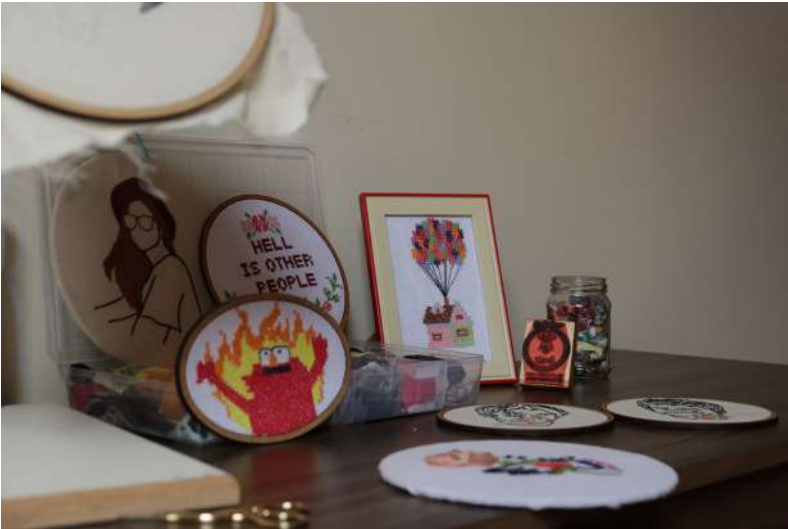
Figura 11: Bordado