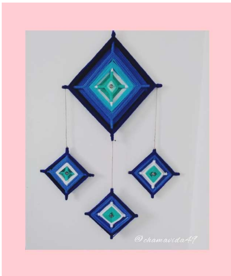
Figura 28: Mandala