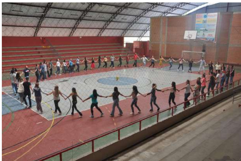
Figura 26: Dança circular