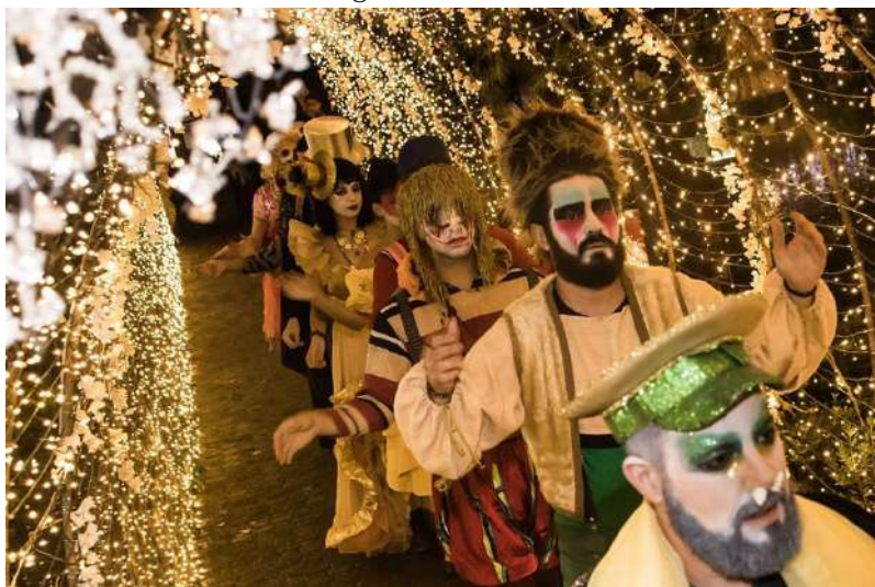
Figura 30: Teatro

“O teatro é um inferno de produção e um paraíso de criação.” Valério Batista Peguini