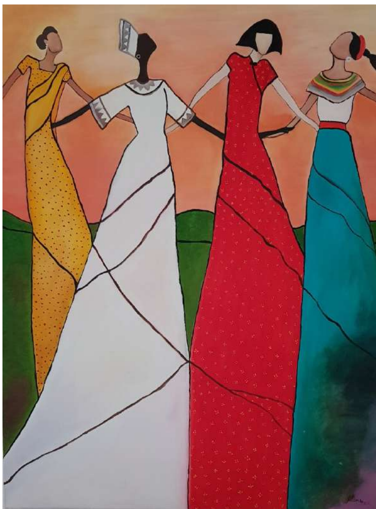
Figura 14: Pintura