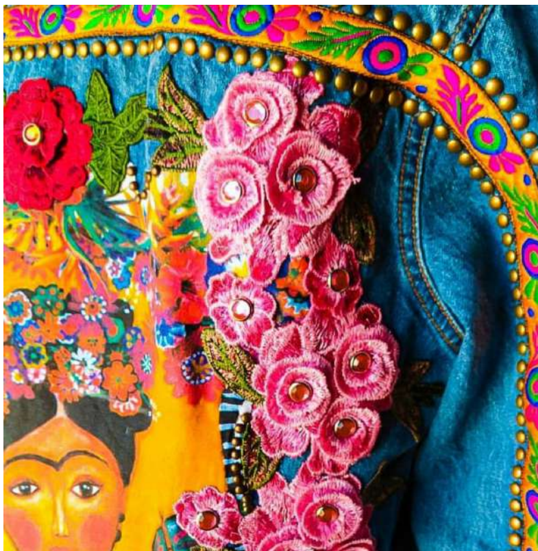
Figura 23: Arte sobre pano