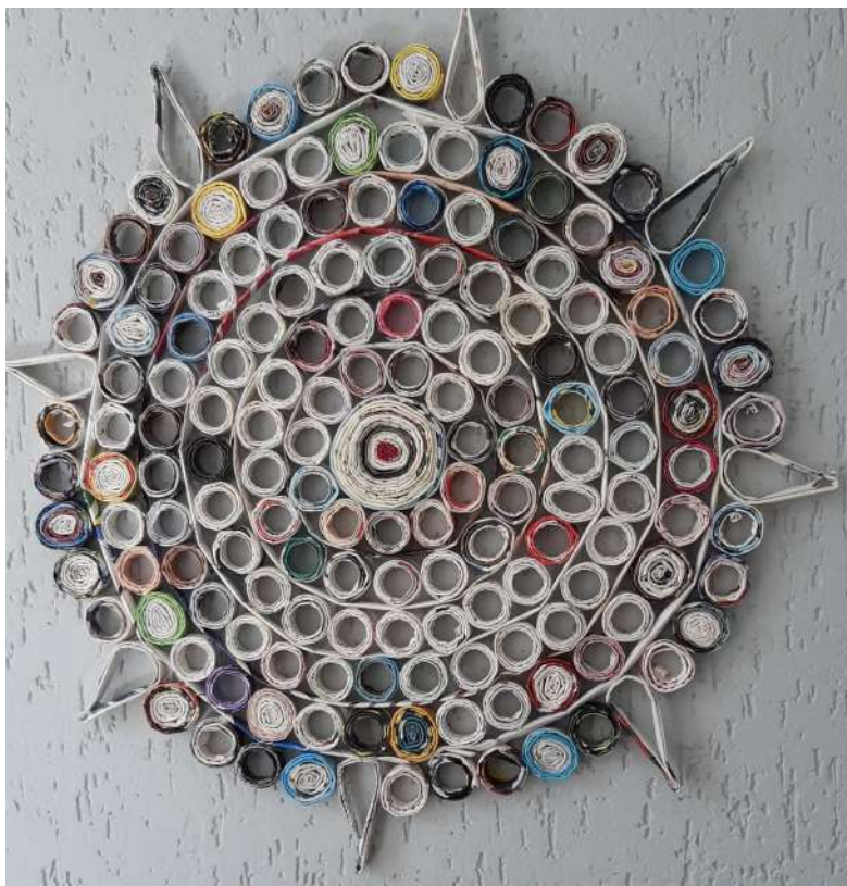
Figura 5: Mandala