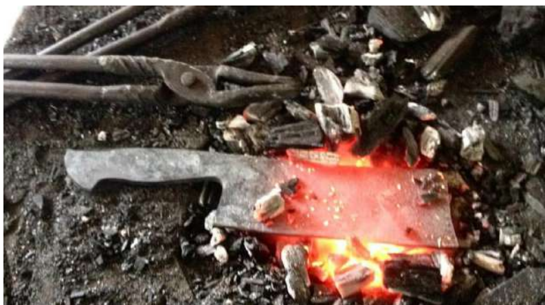
Figura 20: Cutelaria