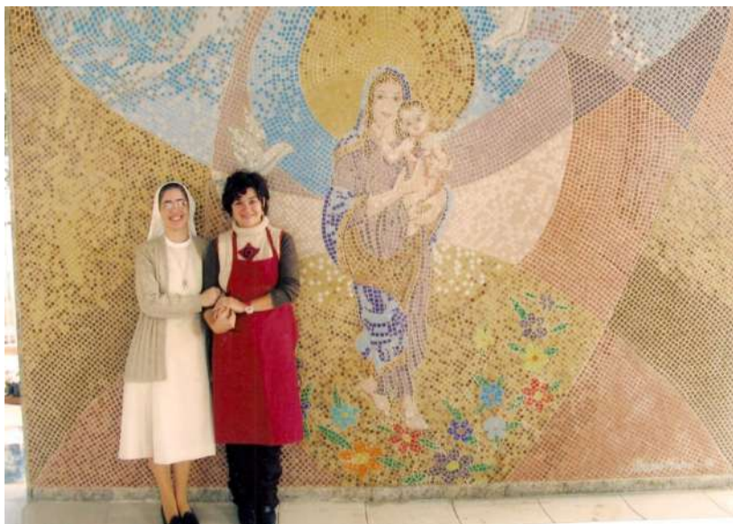
Figura 18: Mosaico

A partir da Lei Aldir Blanc, publicou, por meio do edital de 2020, suas mais recentes produções: o livro Onde eu quero ficar , que reflete, por meio de uma história ilustrada, as novas possibilidades do ficar pós-pandemia; e o livro ilustrado A casinha da vovó , no qual explora, por meio de um conto, o aconchego e a imensidão encontrada na casa da sua vó pela visão de uma criança.