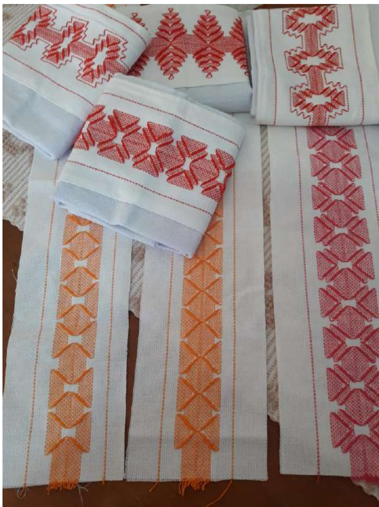
Figura 4: Vagonite