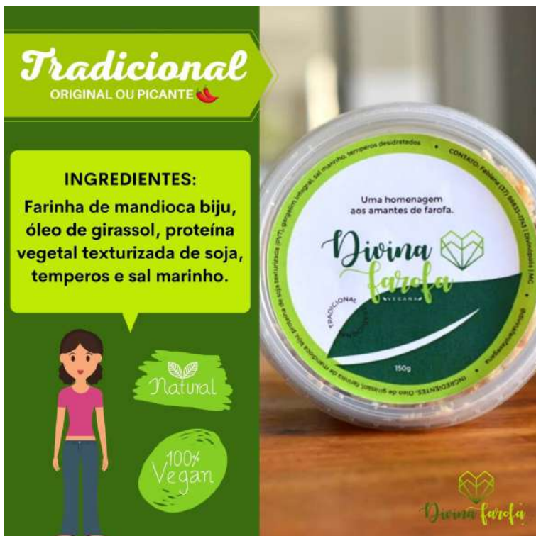
Figura 6: Divina Farofa Vegana Tradicional