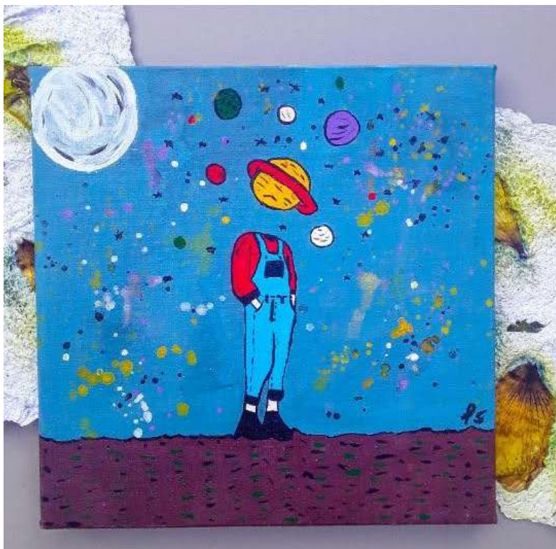
Figura 12: Pintura em tela