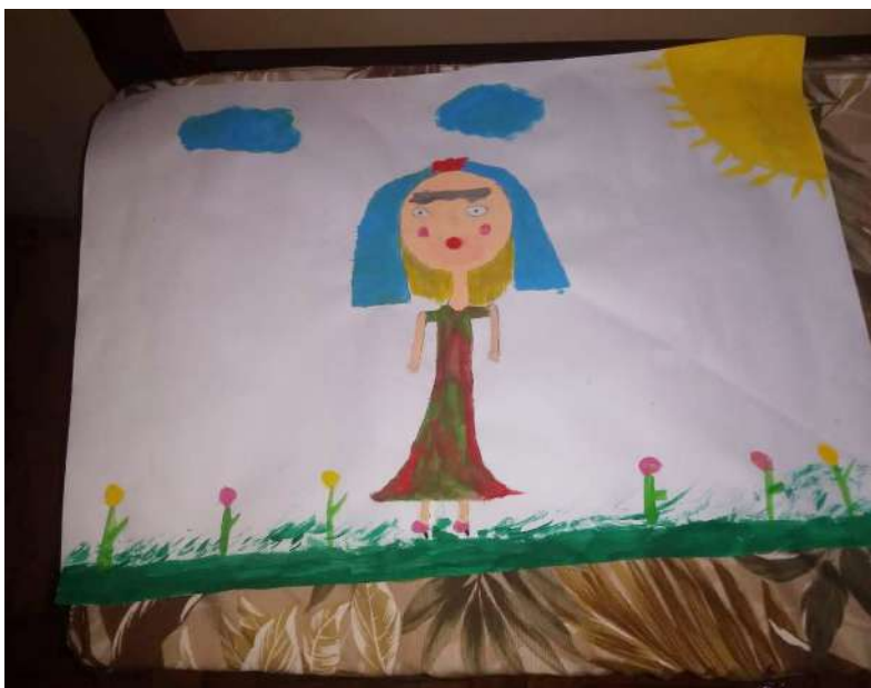
Figura 9: Desenho aquarela

Fonte: Alessandra Aparecida Monteiro Ramos