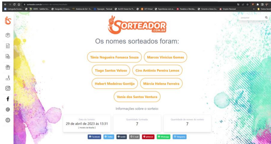
Figura 2 – Ordem das chapas para a votação.