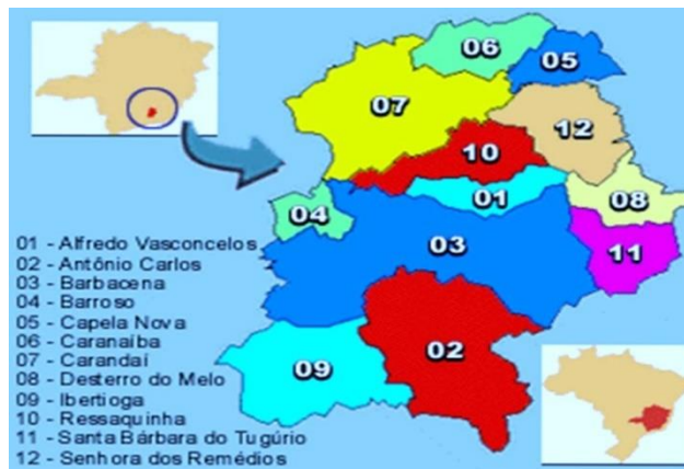
Figura 01: Microrregião de Barbacena e sua localização